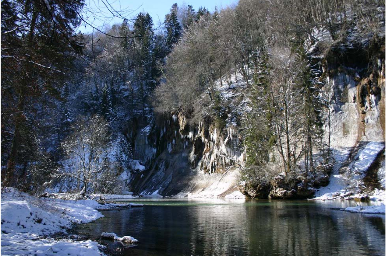
La Petite-Sarine à Corpataux