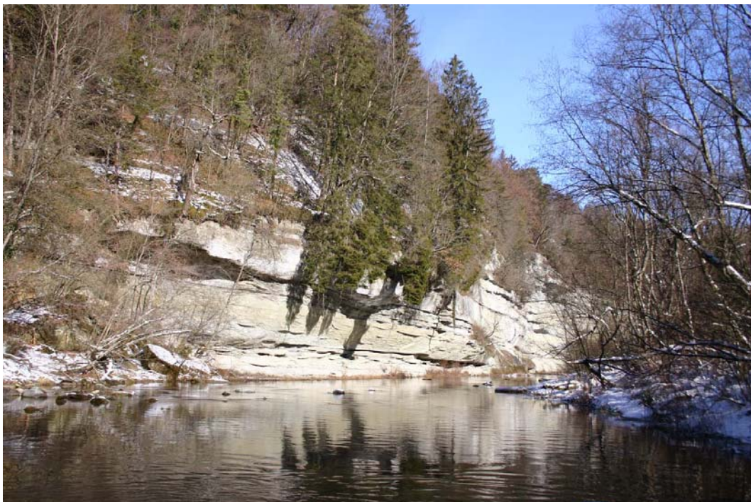
La Petite-Sarine à Illens

La diminution majeure coïncide avec l'augmentation de la taille légale de capture en 1995. Celle-ci passe de 22cm à 26cm et en même temps, le nombre de prises diminue de 1445 à 956. Les captures de 1995 à 2000 sont restées relativement stables. Avec l'instauration de la mesure fenêtre (24-32 /45cm) dès 2001, on recense le plus faible taux de captures de toutes ces années à l'exception de l'année 1998 où une pollution avait provoqué des pertes importantes.